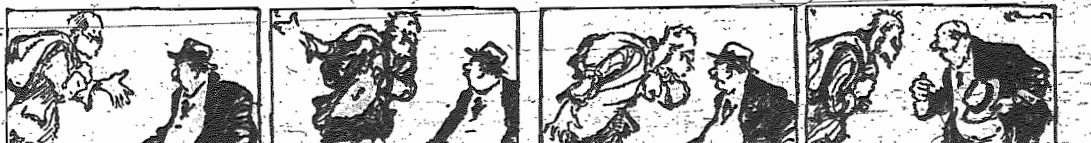
—Sois vosotros, los explotadores, la causa de nuestras desgracias...

"Siempre y en todos los países, la burguesía se apodera de la agricultura por el comercio, y esta "toma de posesión", por decirlo así, es bien pronto seguida del régimen político. He aquí el peligro que no podemos perder de vista. Estamos en vísperas de una lucha con la burguesía por la influencia comercial sobre los campesinos". Recuerdo Lenin que la posesión económica precede a la dominación política? Estamos de acuerdo, entonces, al considerar a los bolcheviques como los enterradores de la revolución, desde que abrieron al capitalismo de par en par las puertas de Rusia: ¿Qué medidas propone Larin para luchar ventajosamente con la burguesía en la dominación de los campesinos? La creación obligatoria de Uniones profesionales de agitadores, las cuales estarán obligadas a tratar únicamente con el gobierno para la venta de sus productos. Naturalmente, los campesinos seguirán odiando la ciudad, mientras en la ciudad haya un gobierno enemigo de la libertad y de la justicia, y los bolcheviques no vencerán a la burguesía en el dominio comercial de la población agrícola de Rusia. Y al no vencer a la burguesía, como lo reconoce Larin, ésta pasará a primar políticamente en los destinos de Rusia.