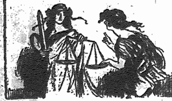
La Justicia.—Todos los pueblos tienen derecho a disponer de sí mismos. La Política.— ¡Oh, sí, menos los que tienen carbón, petróleo y hierro.

La minoría representa consigo la oposición revolucionaria al reformismo. También se compone de varias tendencias. Pero todas sus corrientes convergen en la crítica de la actividad de los jefes de la Confederación, especialmente por su participación en el Bureau obrero internacional. Exigen terminantemente, que los delegados de la Confedera-