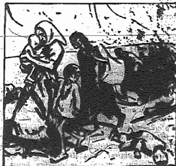
—Con Foch o con Trotsky, los frutos del imperialismo son idénticos.