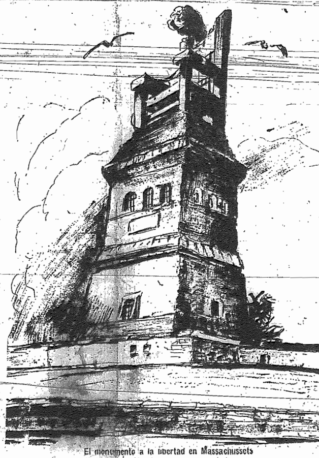
El monumento a la libertad en Massachussets