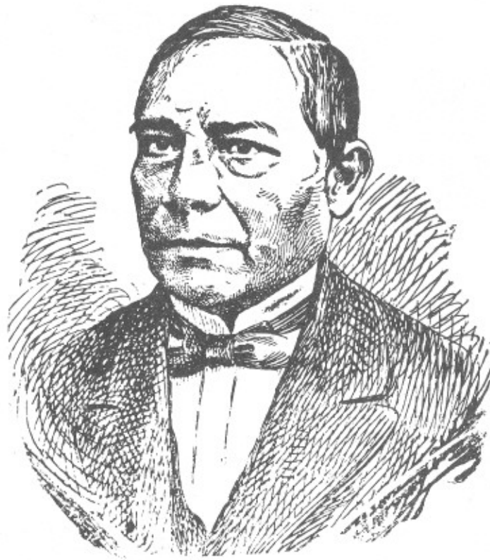
Ciudadano Lic. Benito Juárez

El Comité Patriótico Liberal organizado con el fin de tributar á la memoria del inmortal C. Benito Juárez,